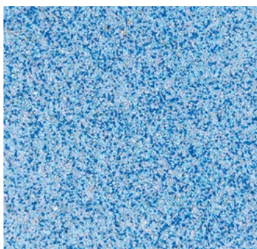
CQS-4608 | 0,3/0,8 mm Base* bleu CQS-4658 | 0,7/1,2 mm