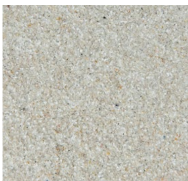
CQS-4601 | 0,3/0,8 mm Base* blanc CQS-4651 | 0,7/1,2 mm

Mélanges de sable de couleur stable pour les revêtements décoratifs antidérapants RX. Faciles à saupoudrer avec une consommation maîtrisable, ponçables pour les surfaces avec niveaux de résistance au glissement R10, R11 et R12.