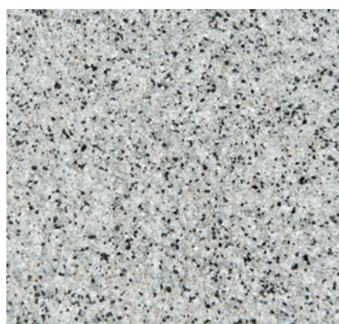
CQS-4701 AS | 0,3/0,8 mm Base* gris clair

Mélanges de sable antistatiques de couleur stable pour les revêtements décoratifs antidérapants RX. Faciles à saupoudrer avec une consommation maîtrisable, ponçables pour les surfaces avec niveaux de résistance au glissement R10 et R11.