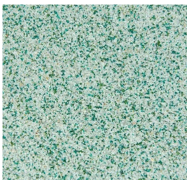
CQS-4607 | 0,3/0,8 mm Base* gris clair CQS-4657 | 0,7/1,2 mm