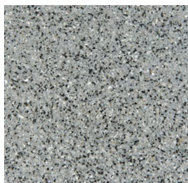
CQS-4603 | 0,3/0,8 mm Base* gris moyen CQS-4653 | 0,7/1,2 mm