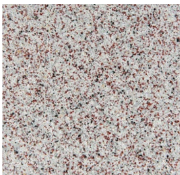
CQS-4704 | 0,3/0,8 mm Base* gris clair