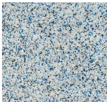
CQS-4703 | 0,3/0,8 mm Base* gris clair