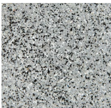
CQS-4702 | 0,3/0,8 mm Base* gris moyen