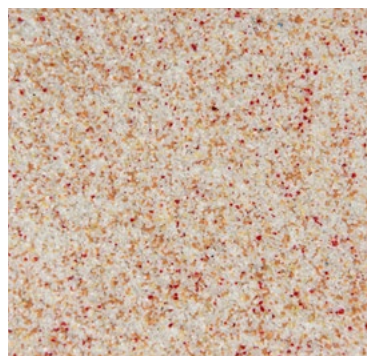
CQS-4606 | 0,3/0,8 mm Base* blanc CQS-4656 | 0,7/1,2 mm