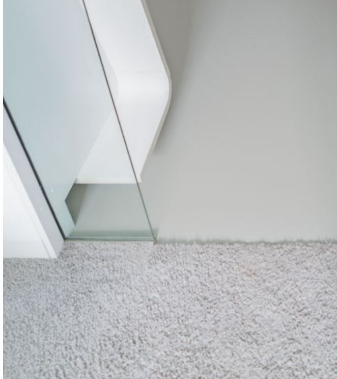
Harmonisch abgestimmte Farben für ein stimmiges Gesamtbild im Büro.